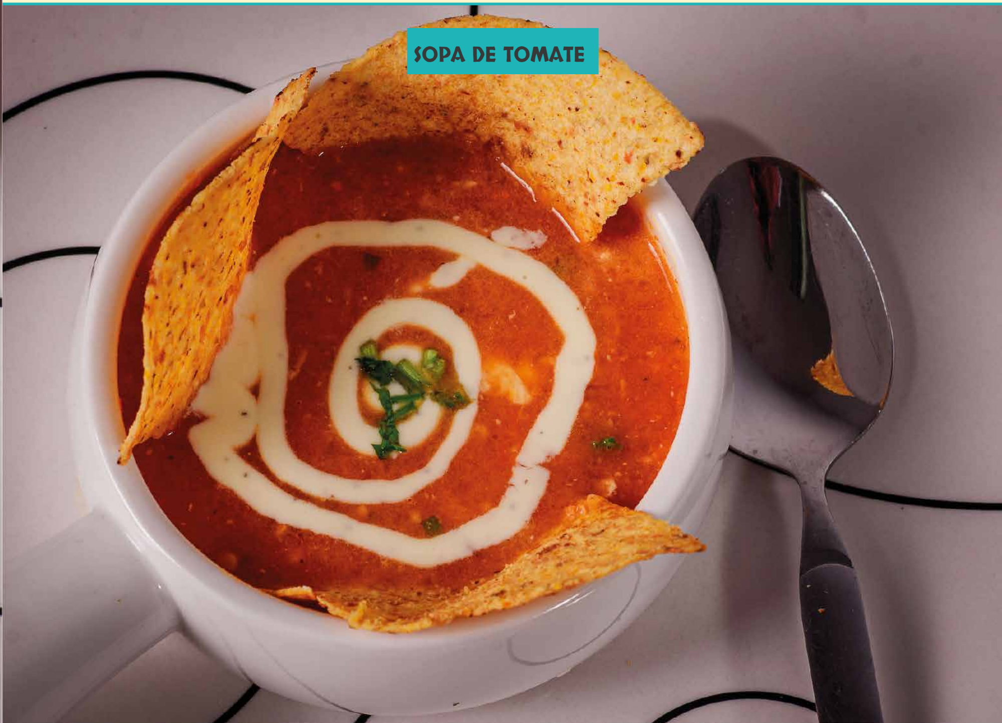
SOPA DE TOMATE